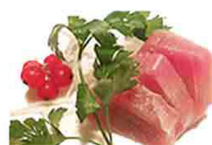
33 €10.00 SASHIMI DI TONNO 10PZ