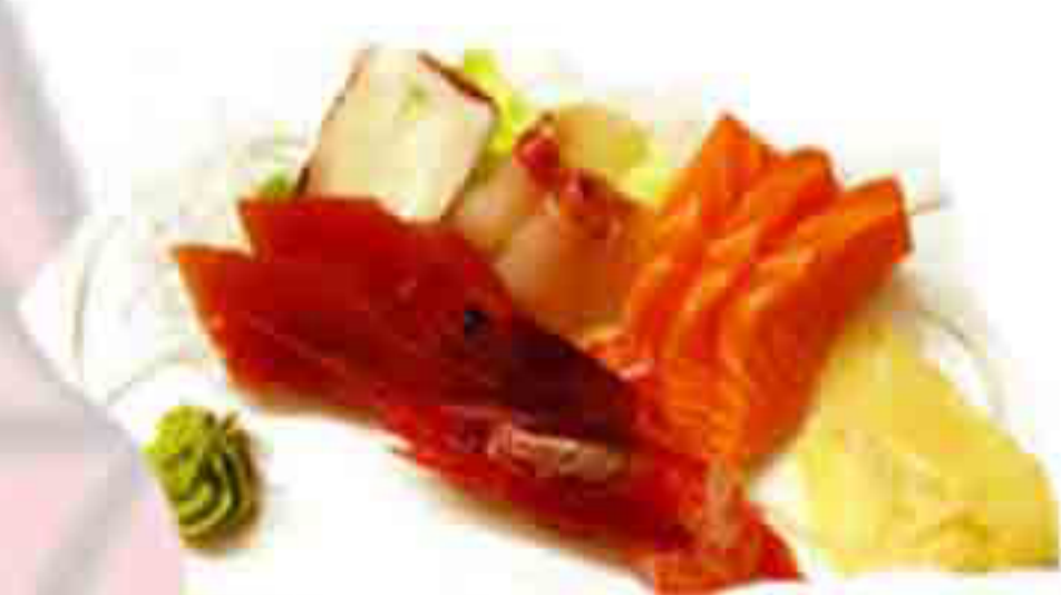
35 €12.00 SASHIMI MISTO 14PZ