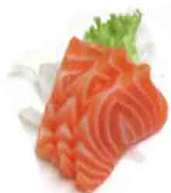
32 €10.00 SASHIMI DI SALMONE 10PZ