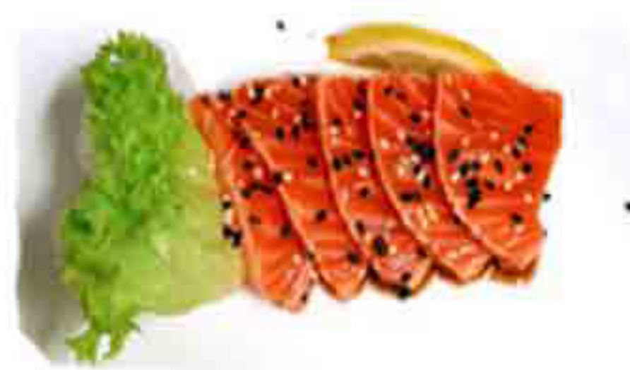
09S €8.00 TATAKI DI SALMONE 8PZ