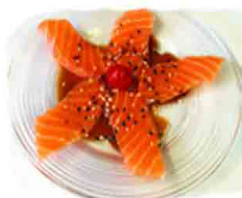
09CS €9.00 CARPACCIO DI SALMONE 14PZ