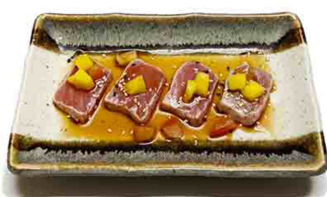
9D €10.00 TATAKI DI TONNO 8PZ