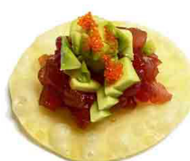
34B €6.00 SANSHI FRIED TUNA FOGLIE, DI INVOLTINI,AVOCADO TARTAR DI TONNO TERIYAKI 2PZ