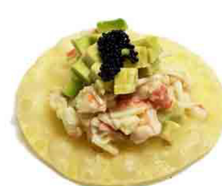
34C €6.00 SANSHI FRIED SURIMI FOGLIE DI INVOLTINI,AVOCADO SURIMI, GAMBERI COTTO 2PZ