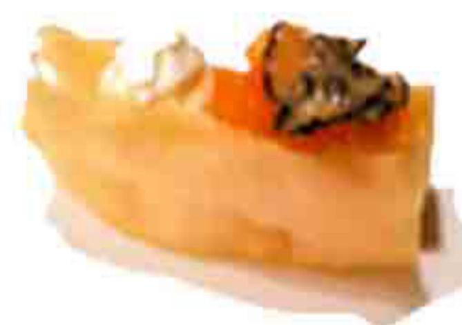
34 €5.00 SFOGLIA FRITTI TARTARA DI SALMONE,PHILADELPHIA TARTUFO 2PZ