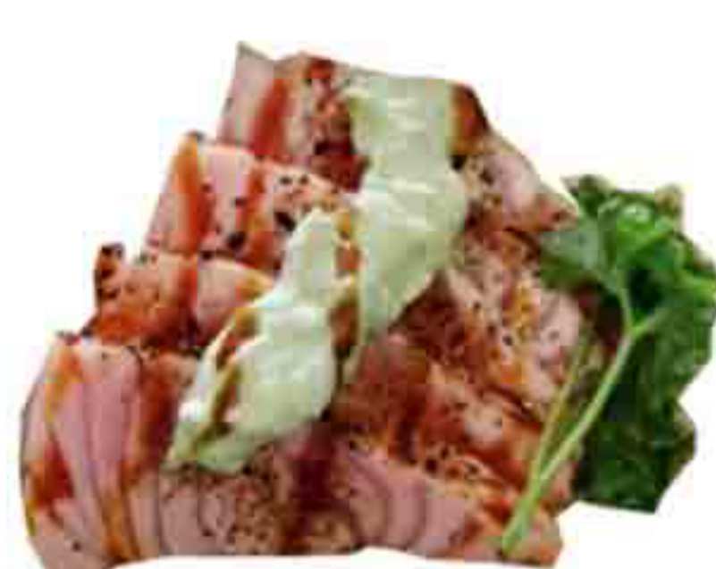
9C €10.00 TATAKI DI SALMONE CON SALSA DI AVOCADO, TERIYAKI 8PZ