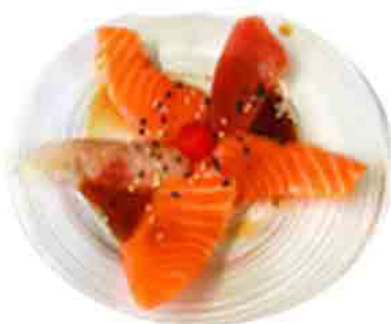
09CM €10.00 CARPACCIO MISTO 14PZ