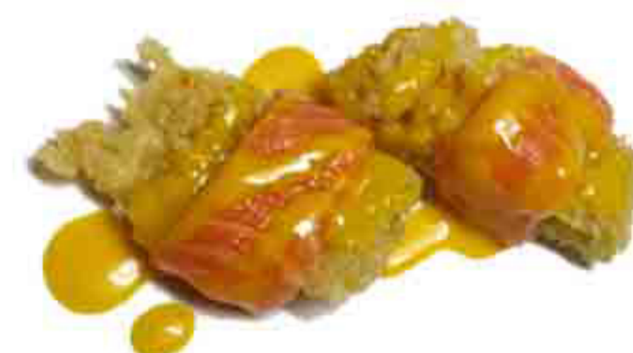
31A €5.00 FIORI DI ZUCCA FRITTI CON SALMONE CRUDO E SALSA DI MANGO 3PZ