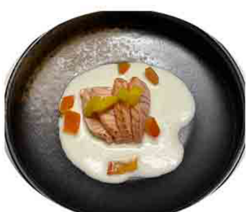
32A €10.00 BURRATA TATAKI DI SALMONE 8PZ