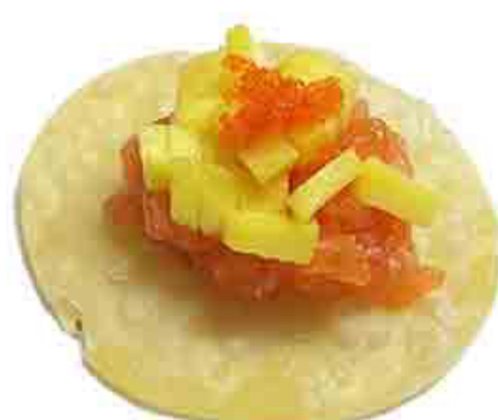
34A €6.00 SANSHI FRIED SAKE FOGLIO INVOLTINI,MANGO TARTAR DI SALMONE TERIYAKI 2PZ