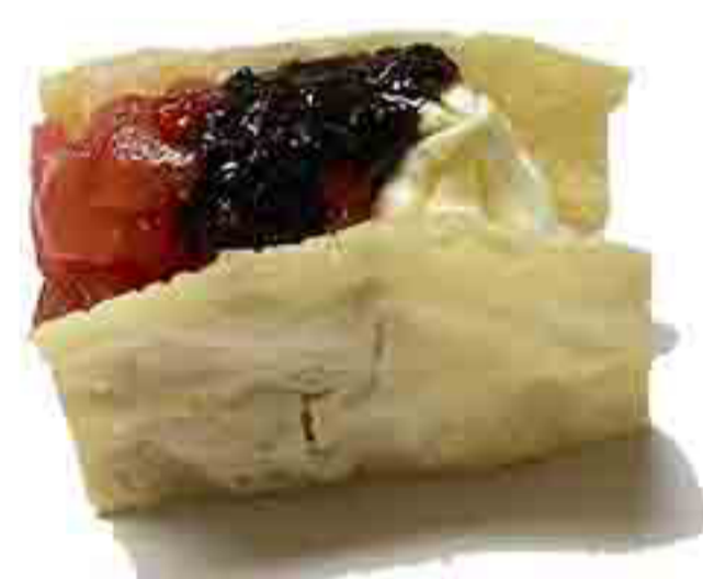
31C €5.00 SFOGLIA FRITTI TARTARA DI TONNO PHILADEL PHIA,TARTUFO 2PZ