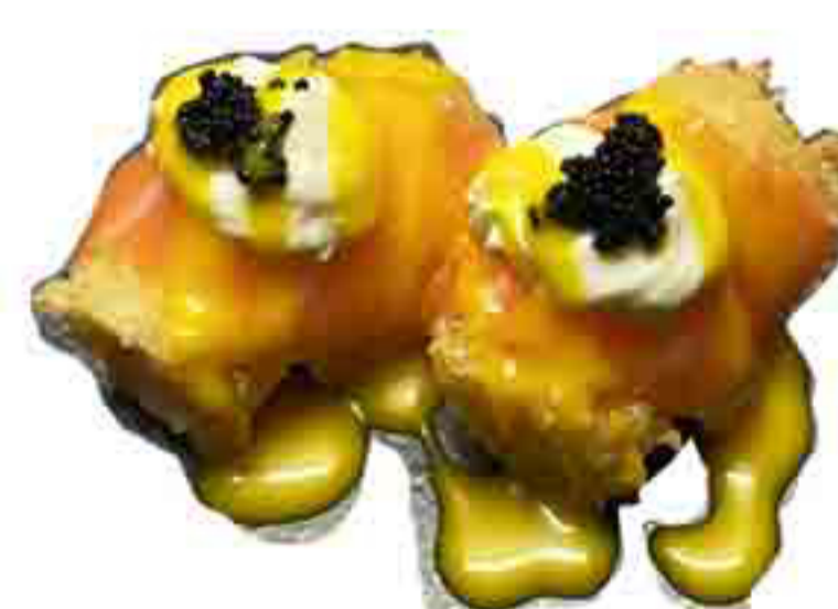
31 €5.00 TEMPURA DI GAMBERI FRITTI CON SALMONE CRUDO E SALSA DI MANGO 3PZ