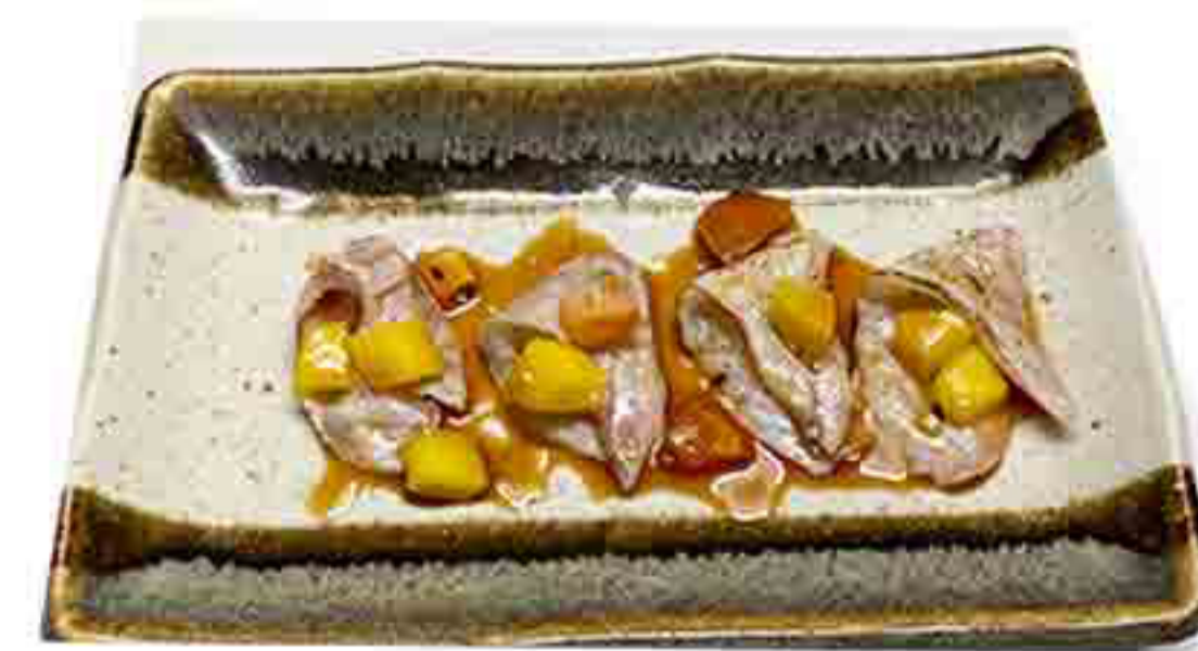
9B €10.00 TATAKI DI BRANZINO 14PZ