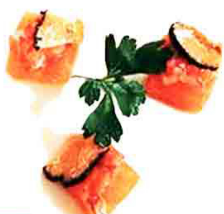
31B €6.00 SALMONE AMAEBI TARTUFO 6PZ