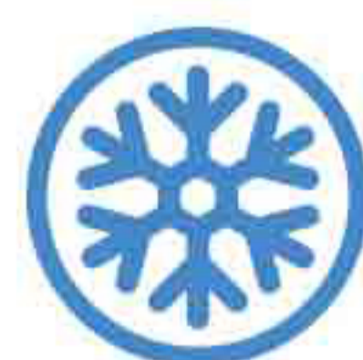
TABELLA ALIMENTI CHE CONTENGONO ALLERGENI

Si avvisa la gentile clientela che le nostre pietanze possono contenere, come costituenti base o in tracce alcune sostanze considerate allergeni. Pertanto prima dell'ordine si prega ai gentili ospiti di informare il cameriere in servizio riguardo eventuali allergie o intolleranze. Sostanze o prodotti che provocano allergie o intolleranze ( Allegato II Regolamento CE 1169 )