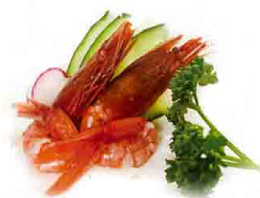
33A €10.00 GAMBERI CRUDI 6PZ.